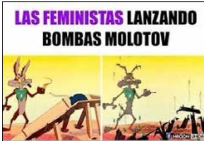
Imagen 6 Meme #Feministas lanzando bomba molotov

desarrolla el sexismo mediático a través de la intertextualidad de una cultura machista.