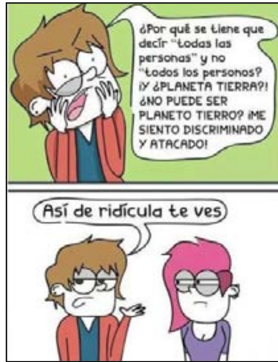
Imagen 4 Meme lenguaje inclusivo

Los intercambios que surgen dentro de las redes dotan de significado el contenido de las unidades de información ligadas a una cultura que se transmite por medio de dichas redes y que, tal como lo decía Richard Dawkins en la teoría memética (1976), las unidades que se transmiten de un individuo a otro se difunden y mutan de sentido y significado de acuerdo con la estructura cultural de cada sujeto.