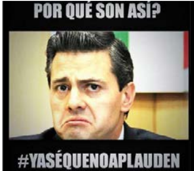
Imagen 3 Meme #YaSeQueNoAplauden

previamente dicho por la ex primera dama con respecto al pago de la casa y su sueldo como actriz. De acuerdo con el meme, el trabajo de Angélica Rivera es tan bien pagado que incluso podría alcanzar para que el país salga de su deuda con otros países.