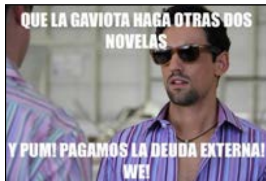
Imagen 2 Meme de burla a "La Gaviota"

Con el fin de ejemplificar lo anteriormente expuesto, se presentan, la corrupción en México de manera general, particularmente el famoso caso de la casa blanca de Enrique Peña Nieto y el machismo; dichas temáticas de los memes en cuestión fueron elegidas para visibilizar algunos de los principales fenómenos sociales involucrados en gran medida dentro de las redes sociales y sobre todo, la influencia visible que tienen en sus usuarios y cómo es que, a raíz de esto, surge el contenido memético, además de exponer las diferentes funciones del mismo: en este caso se abordará la crítica-sátira y la ofensa con imágenes cargadas de signos que complementan el mensaje.