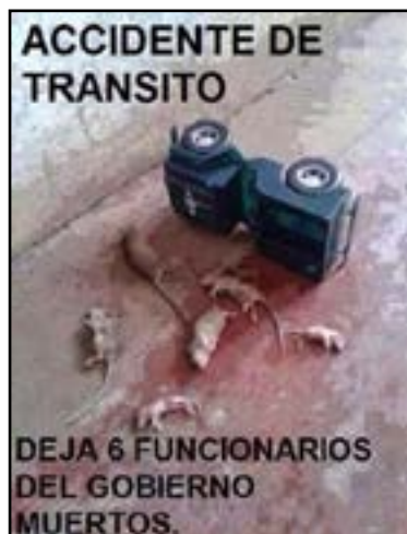
Imagen 1 Meme sobre política