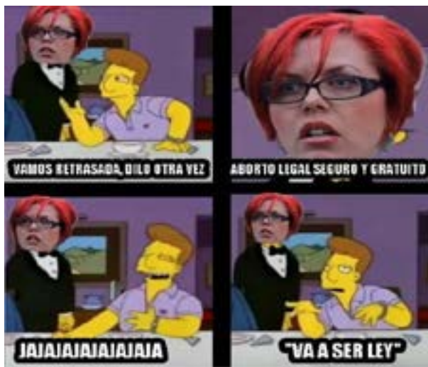
Imagen 5 Meme como burla hacia el aborto

mujeres con tal apariencia son “malas”, “feas” y “tontas”; por tanto, da origen a conductas de rechazo en aquellas personas que no empatizan con el movimiento feminista; igualmente, aquellas mujeres que encajan dentro del estereotipo se vuelven objeto de burla, discriminación y violencia, cerrando un círculo vicioso de carácter completamente misógino.