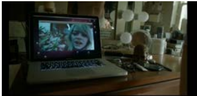
Imagen 4. Videollamada con Sam Thomson. (Iñárritu, 2014)

Riggan Thomson enciende la computadora y tiene una conversación con su hija (Imagen 4); tras un par de diálogos sabemos que es su hija y que trabaja para él, también se destaca la relación que tiene con ella, la cual es muy mala y se basa en el desinterés mutuo.