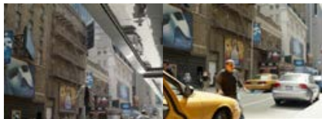
Imagen 28. No voló, iba en taxi. (Iñárritu, 2014)