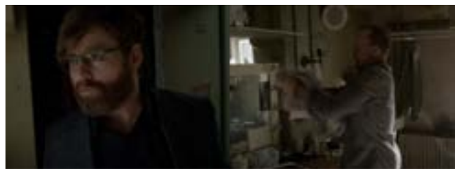
Imagen 26. Perspectiva de un tercero. (Iñárritu, 2014)

Sin embargo, el director ocupa las ilusiones del personaje protagónico para usarlas como metáforas visuales; el vuelo representa su deseo por tener la atención del público pero, como todo vuelo, necesita tirarse con un acto de fe, ya que puede tener la posibilidad de caer al suelo o ascender sobre él. Es aquí cuando se presenta el segundo vuelo, culminando con la película, el arco narrativo de nuestro personaje principal y contestando las incógnitas: ¿Murió? O ¿Vivió?