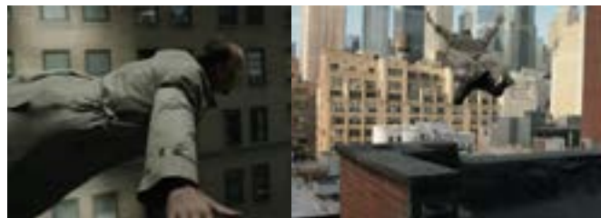
Imagen 27. Riggan vuela por la ciudad. (Iñárritu, 2014)