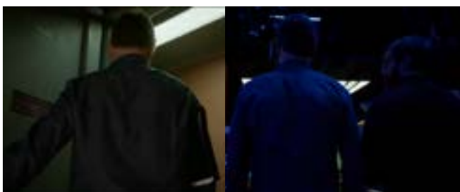
Imagen 8. Conversación entre Riggan y su abogado/representante. (Iñárritu, 2014)

Después, observamos a nuestro protagonista salir del camerino y es en este momento que el director Alejandro González Iñárritu sugiere dos herramientas principales, el plano secuencia como herramienta narrativa y el simbolismo de dicha técnica: la cámara hace un recorrido junto con el protagonista y nos refleja el contexto físico, todo se está llevando a cabo en un teatro; como sabemos, una de las características del teatro es la actuación en vivo, no existen los cortes como en el cine, sin embargo, en este filme se ocupará el plano secuencia para igualar esa característica del teatro.