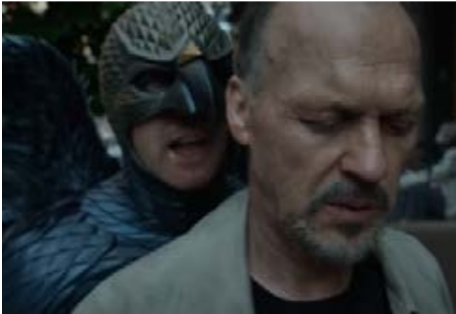
Imagen 13. Primera aparición visual de Birdman. (Iñárritu, 2014)