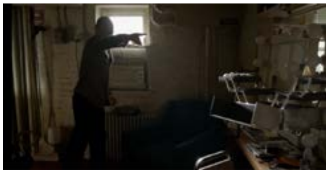
Imagen 25. Telequinesia (Iñárritu, 2014)

Por ejemplo, en un plano nos muestra la telequinesis que tiene Riggan sobre los objetos, pero a los pocos minutos la cámara genera un paneo que rompe repentinamente las ilusiones de nuestro protagonista, evidenciando que su poder sobrenatural solo es una furia contenida que lo lleva a romper y arrojar objetos con sus propias manos (Imagen 25).