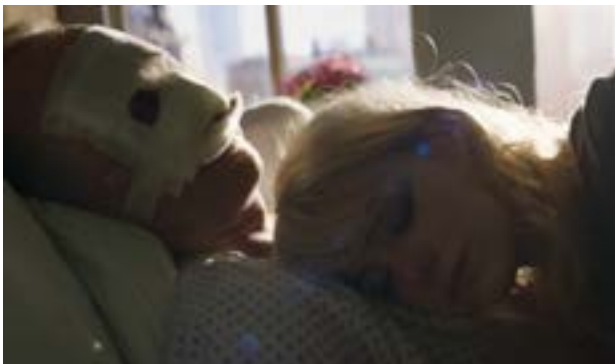
Imagen 20. Padre e hija. (Iñárritu, 2014)