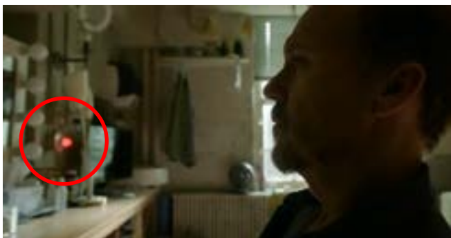
Imagen 7. Paneo derecho (Iñárritu, 2014)

presencia nuevamente, cuando nos indica que nuestro protagonista retoma su realidad, esto lo demuestra a través de dos símbolos, el sonoro con la llamada de su asistente y el visual con la alarma.