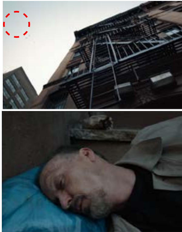
Imagen II. Contrapicada y Riggan en el basurero. (Iñárritu, 2014)

La secuencia inicia con un plano en contrapicada, mostrándonos un inmenso edificio y paralelamente aparecen tres pájaros, indicándonos la superioridad que mantiene Birdman sobre Riggan, esto se refleja con el siguiente movimiento de cámara, un plano en picada mostrándonos a Riggan dormido en una bolsa de basura y con un aspecto físico deteriorado (Imagen II).