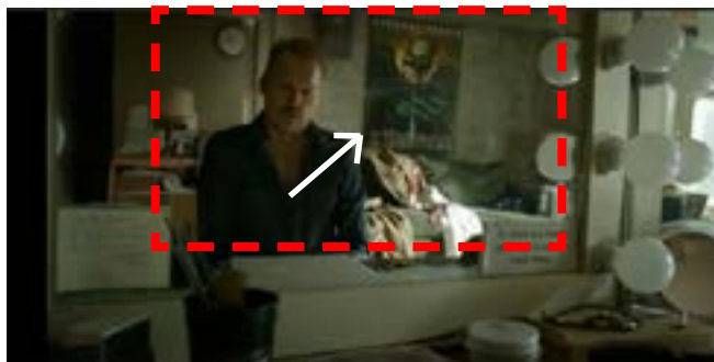
Imagen 6. Riggan Thomson y Birdman . (Iñárritu, 2014)

Al terminar la conversación, Riggan cierra la computadora mientras que la cámara hace un ligero Tilt Up (Imagen 5), y nos muestra por primera vez el rostro del protagonista, pero también el rostro de la voz misteriosa, es en este momento que nos confirma el origen y aspecto de dicha voz (Imagen 6); todas estas características son narradas de manera visual.