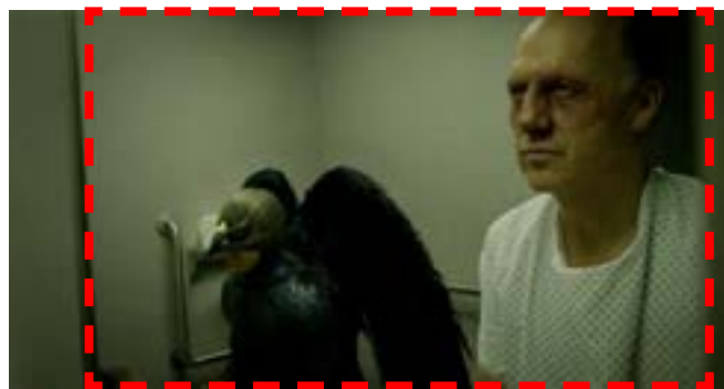
Imagen 22. Productos desechables. (Iñárritu, 2014)