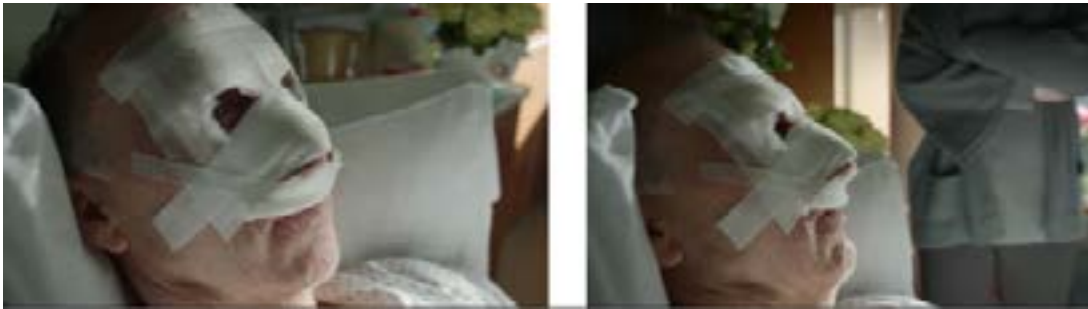
Imagen 18. Riggan en el hospital. (Iñárritu, 2014)