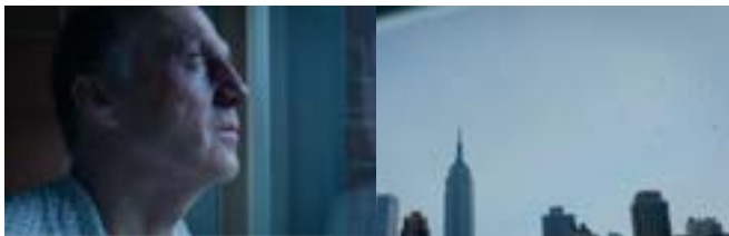
Imagen 23. Vislumbrando el horizonte. (Iñárritu, 2014)

Posteriormente, Riggan se retira del baño para observar por la ventana del cuarto, apareciendo la inmensidad desde un edificio alto y un grupo de pájaros (Imagen 23), todo esto lo observa estando en un punto alto y ya no desde abajo, es por eso por lo que abre la ventana para realizar su vuelo, el cual todos están mirando, como su hija (Imagen 24); Riggan transcurrió como personaje y venció su conflicto personal y se convirtió en un actor reconocido por algo artístico.