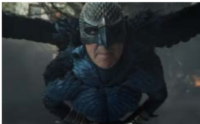
Imagen 14. Ruptura de la cuarta pared. (Iñárritu, 2014)

Hago énfasis en el término cínico, porque la mayoría de las películas de superhéroes, de acción, ciencia ficción, terror, etc., comenten el error de ser excesivamente explicativas, agregándole mayor importancia al montaje espectacular y la popularidad de los actores, dejando al olvido el guion. Esta secuencia pone en juego la postura de nuestro protagonista, ya que nos muestran su rostro extasiado por todo lo que Birdman le mencionó y la fantasía continúa cuando Riggan se eleva (Imagen 15).