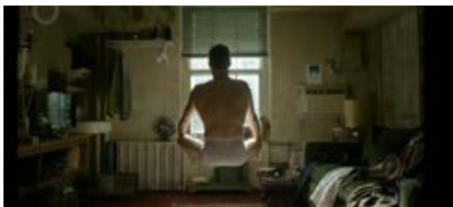
Imagen 1. Primera escena de Birdman . (Iñárritu, 2014)

El primer cuadro de la película (Imagen 1) nos muestra las reglas de la misma, al protagonista, su entorno, y su ideología, es un inicio perfecto por el buen uso del círculo de dardos 4 ; posteriormente aparece el diálogo, como segundo término, ya que el primero fue el aspecto visual, y nos muestra al segundo personaje que funge como un antagonista de Riggan Thomson, esto se refleja con sus primeras líneas que son insultantes, sin embargo, todavía no sabemos quién o de dónde proviene dicha voz, esta incógnita se resuelve por la puesta en cámara: