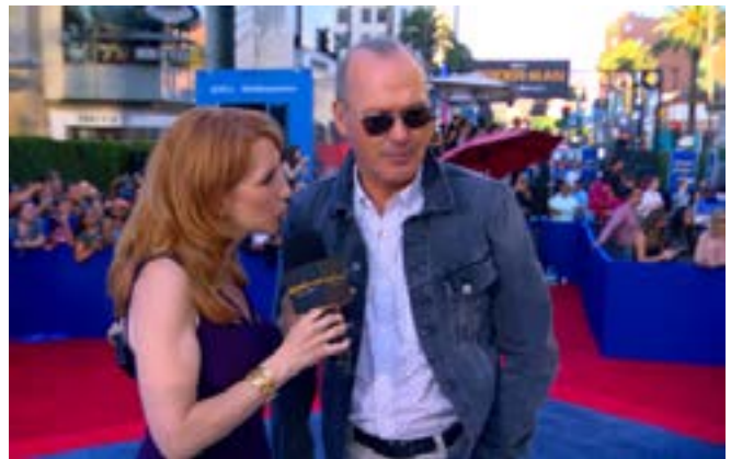
Alfombra roja de Spider-Man: de regreso a casa .