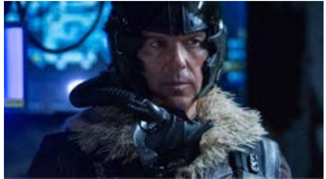
Spider-Man: de regreso a casa , (Watts, 2017)

Podría verse esta secuencia como un montaje bastante exagerado, sin embargo, el argumento que sugiere González Iñárritu es humano y entendible, un ejemplo claro es el actor Michael Keaton que interpreta a Riggan Thomson, se trata de un actor completamente olvidado, el público solo lo recordaba por Batman de 1989, película dirigida por Tim Burton, años después dicho actor regresa con un cenital amplio por Birdman en 2014, colocándose nuevamente como un actor de prestigio, tres años después, el actor toma el papel de El Buitre, antagonista de la película, El hombre araña regresa a casa (2017).