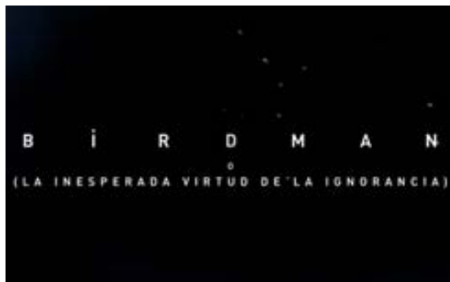
Imagen 30. Fin. (Iñárritu, 2014)

Tampoco podemos dejar de lado la crítica que se hace a la industria cinematográfica, y que se muestra con diversas herramientas narrativas como el diálogo, el diseño de producción y el ámbito que estamos estudiando, la fotografía; González Iñárritu logra reunir cada aspecto narrativo de su discurso en algo visual y con una ejecución que nos demuestra su solidez como cineasta y escritor.