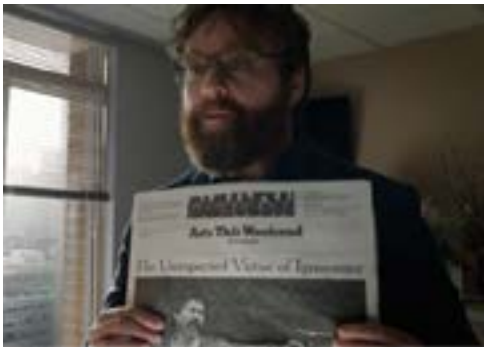
Imagen 19. Buenas noticias. (Iñárritu, 2014)