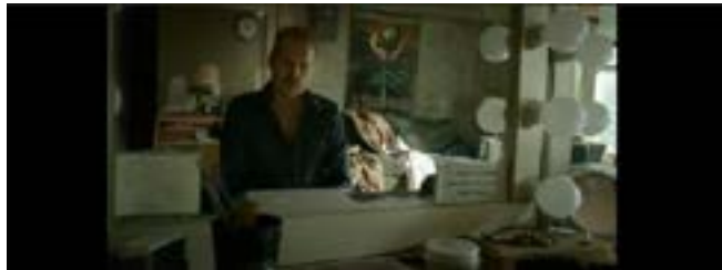
Imagen 5. Tilt Up. (Iñárritu, 2014)

Al terminar la conversación, Riggan cierra la computadora mientras que la cámara hace un ligero Tilt Up (Imagen 5), y nos muestra por primera vez el rostro del protagonista, pero también el rostro de la voz misteriosa, es en este momento que nos confirma el origen y aspecto de dicha voz (Imagen 6); todas estas características son narradas de manera visual.