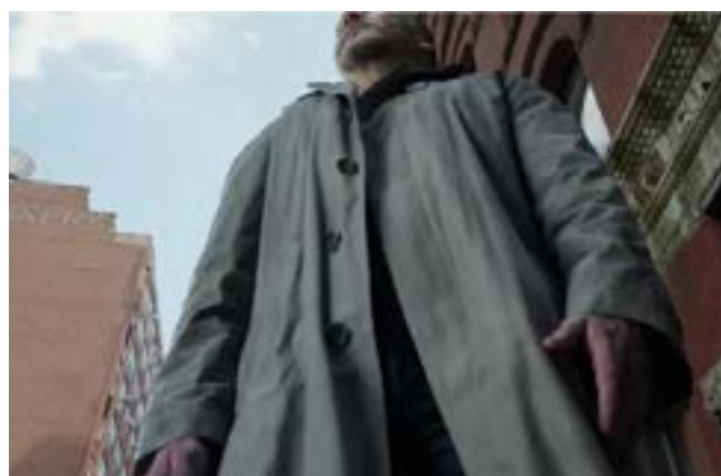
Imagen 15. Vuelo de Riggan. (Iñárritu, 2014)