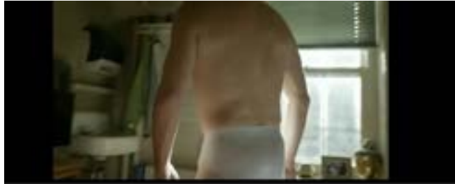
Imagen 3. Paneo izquierdo. (Iñárritu, 2014)

La cámara realiza un paneo izquierdo, demostrando que el protagonista retoma su realidad (Imagen 3); otro factor que nos indica esto es el sonido, la interrupción de los mensajes de la computadora. La película ya nos estableció sus reglas, habrá un juego entre la realidad y la ilusión. La toma avanza y notamos el primer ámbito familiar que tiene nuestro personaje principal.