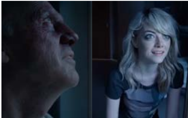
Imagen 29. Trascendió. (Iñárritu, 2014)

La misma fórmula se presenta con respecto a mostrar la ilusión y la realidad, no obstante, el director invierte este proceso, relevándonos que la perspectiva de Riggan es lo que siempre importó en la historia. La realidad se presenta primero, con los reporteros, la interacción de su mánager, hija y esposa y el bullicio mediático, después cuando el personaje se encuentra solo, observando la ventana, la música aparece lentamente y es en ese momento que la ilusión inicia; Riggan no expresa ninguna opinión con respecto a lo externo, a él solo le importa una cosa, el ascenso, volar, ser observado por los otros de la manera que él deseaba; desde el lado artístico, Riggan Thomson trascendió (Imagen 29).