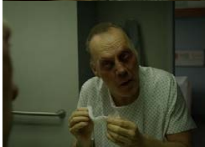
Imagen 21. Quitándose la máscara. (Iñárritu, 2014)