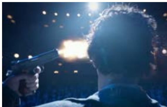
Imagen 17. Acto final de Riggan. (Iñárritu, 2014)