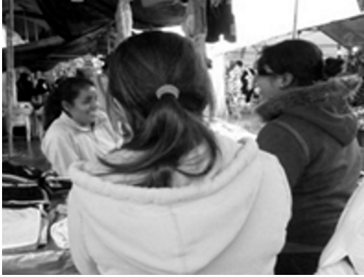
Primeras entrevistas en Coscomatepec