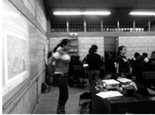
Talleres en el Bachillerato de La Salle Ayahualuco