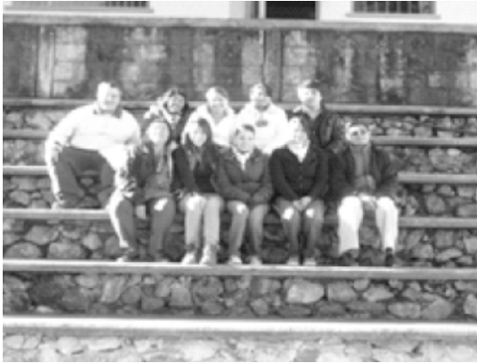
Despedida del albergue de La Salle Ayahualuco